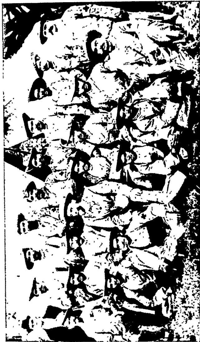
गांधीजी : बोअर युद्धमें भारतीय आहत-सहायक बलके साथ बायसे पांचवें, उनकी बाहिनी और डॉ० बूय